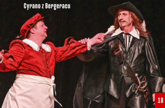
Cyrano z Bergeracu