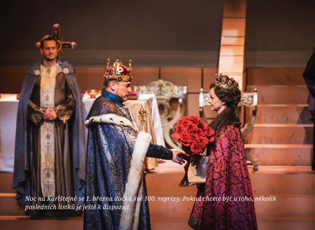
Noc na Karlštejně se 1. března dočká své 100. reprízy. Pokud chcete být u toho, několik posledních lístků je ještě k dispozici.