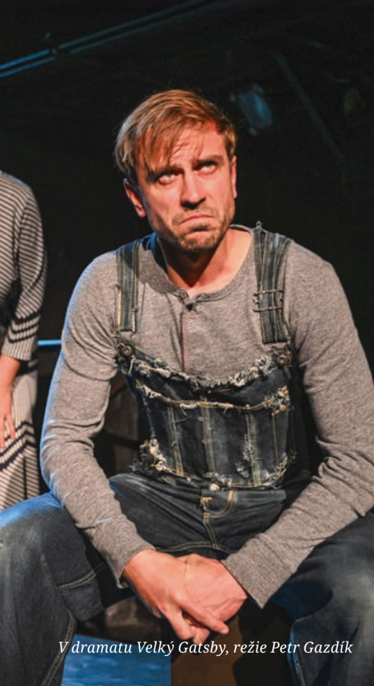
V dramatu Velký Gatsby , režie Petr Gazdík

ani film Heidi jsem neviděl. ( smích ) Moje role je rozsahem velmi malá, hraju starostu, který přivítá hosty ve vesničce Maienfeld, kde se děj odehrává, řekne pár vět a už se na scéně neobjeví. Zatím ale vše vypadá moc hezky, hlavní hrdiny hrají děti a všechny tři alternace jsou úžasné a roztomilé. A myslím si, že stejné přídomek bude mít i výsledný kus. Muzikál bude opravdu milý, příjemný, dětskými výkony rozkošný a určitě si najde svého diváka.